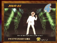
9連荘 「アゲアゲEVERY☆騎士」