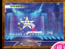
アンコールモード 時短40回or100回