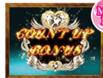
カウントアップボーナス(CUB)