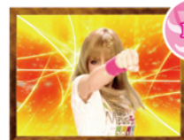
ジャンプアップボーナス(JUB)