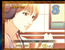
3連荘 「アニメダイジェスト」