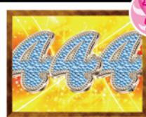
確変 or 通常大当り