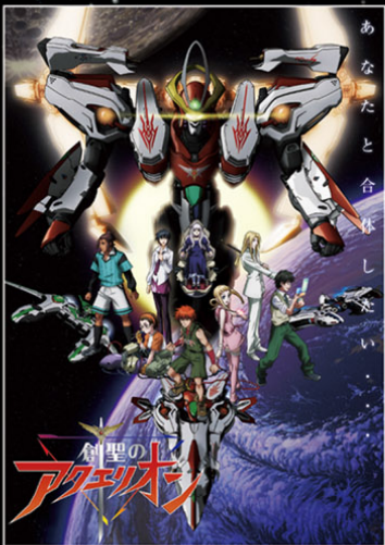
©2004 河森正治・サテライト/Project AQUARION ©2007 河森正治・サテライト/Project AQUARION

創聖紀0011年の地球——人類は、その人口の2/3を失っていた。11年前の大異変が原因である。