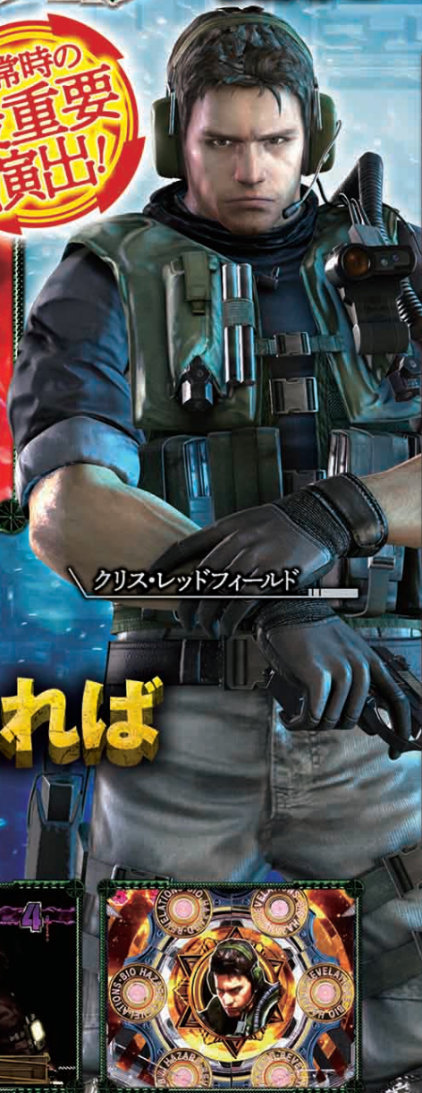
クリス・レッドフィールド