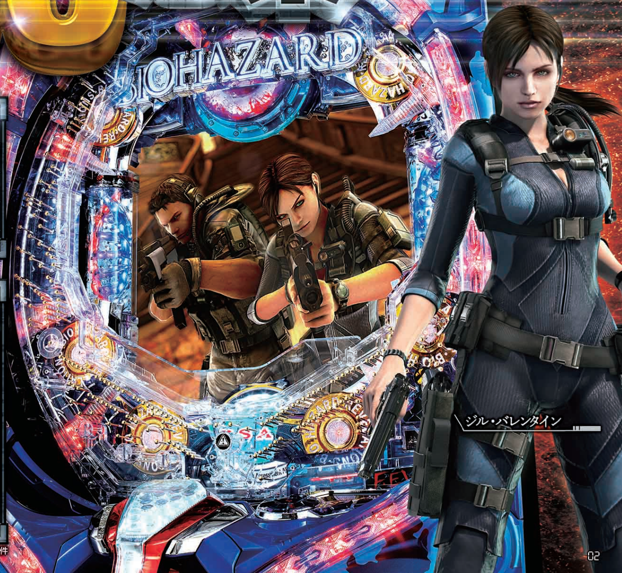
ジル・バレンタイン