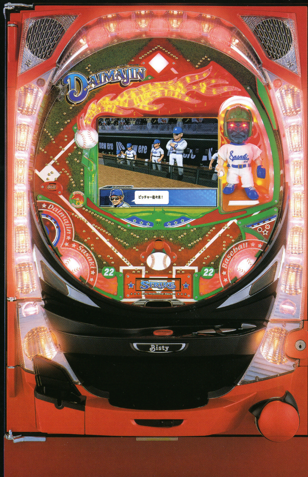
※写真の盤面はZFです。