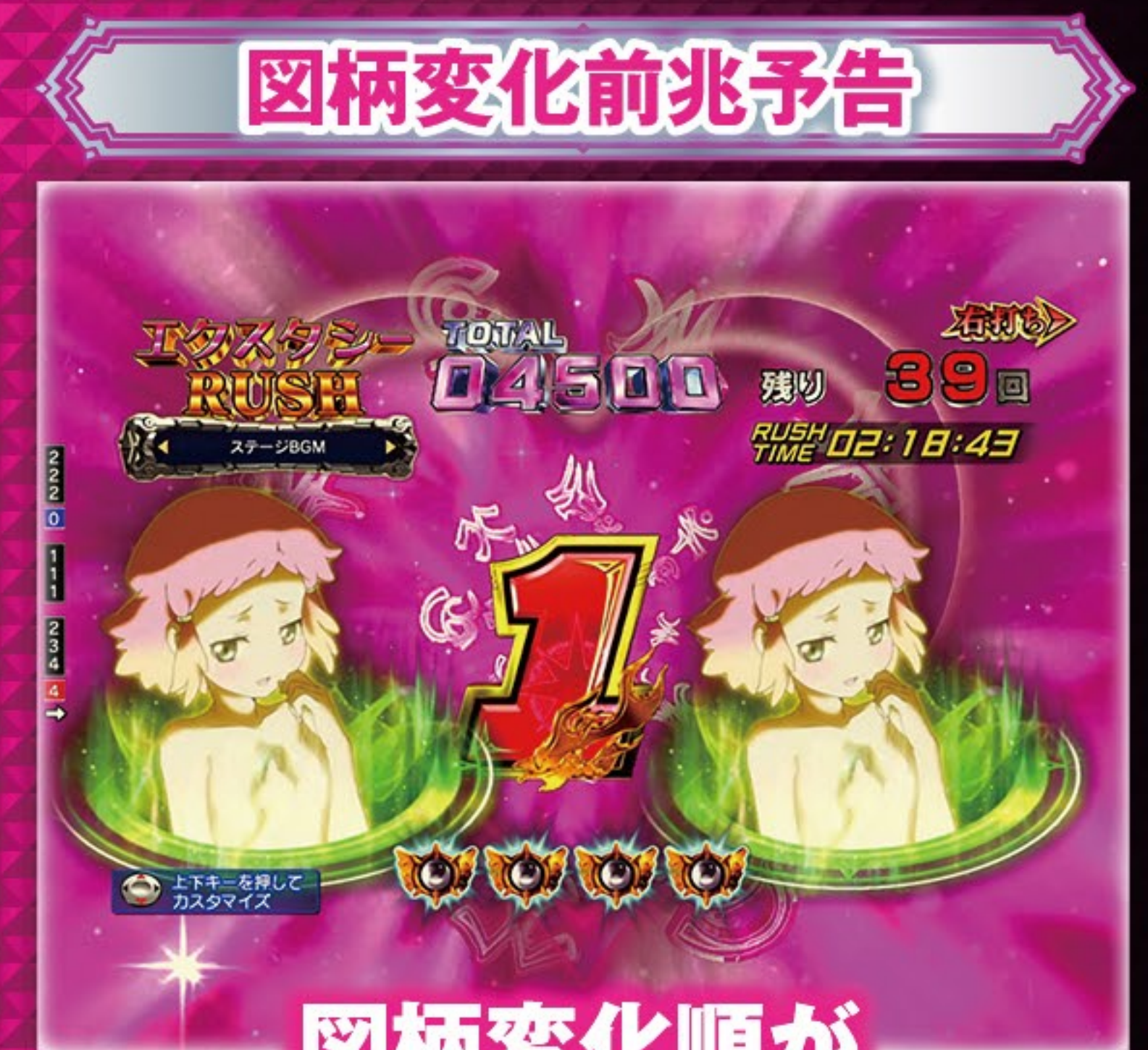
図柄変化順がいつもと違うと!?