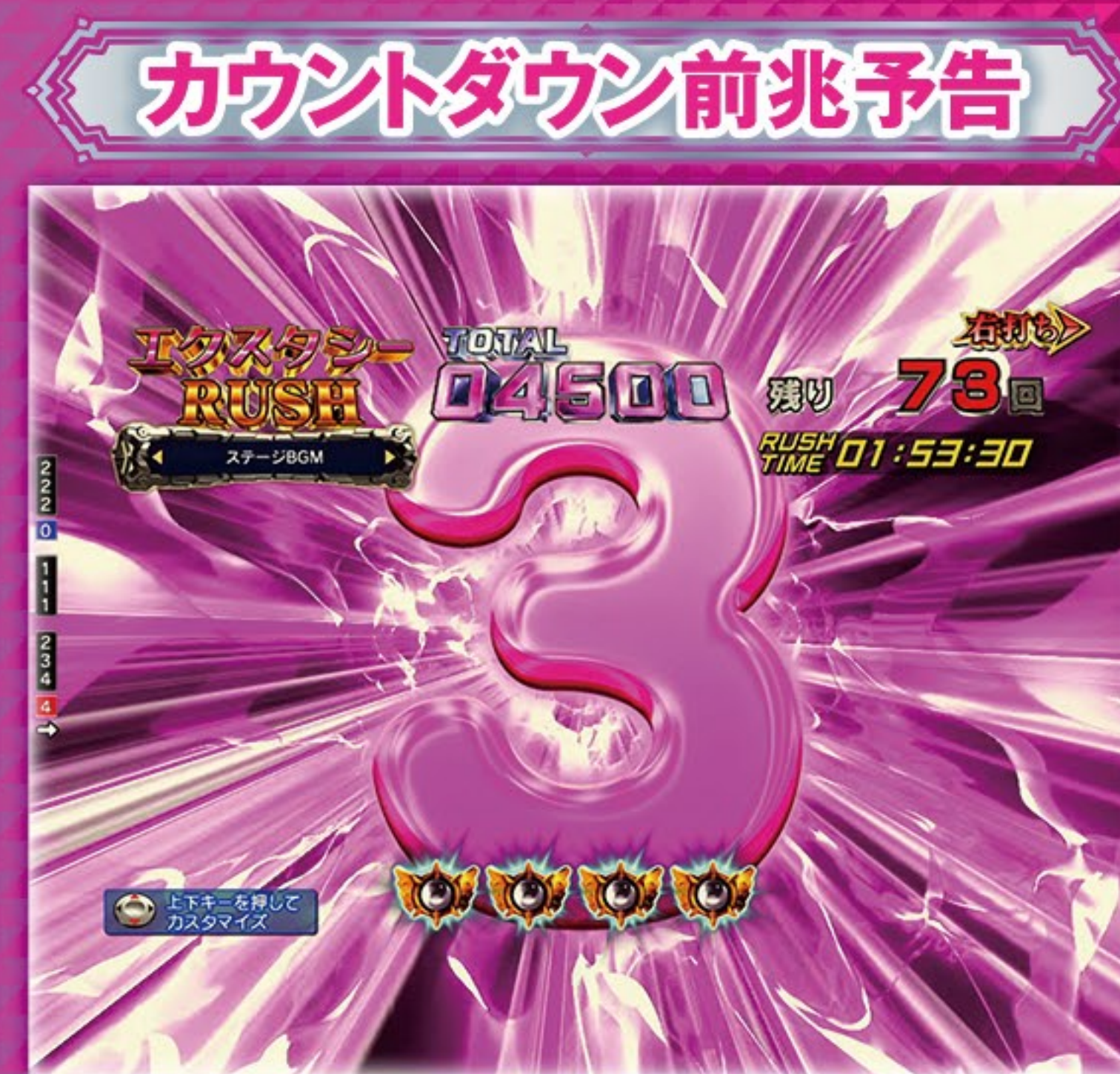
発生すれば大チャンス!?