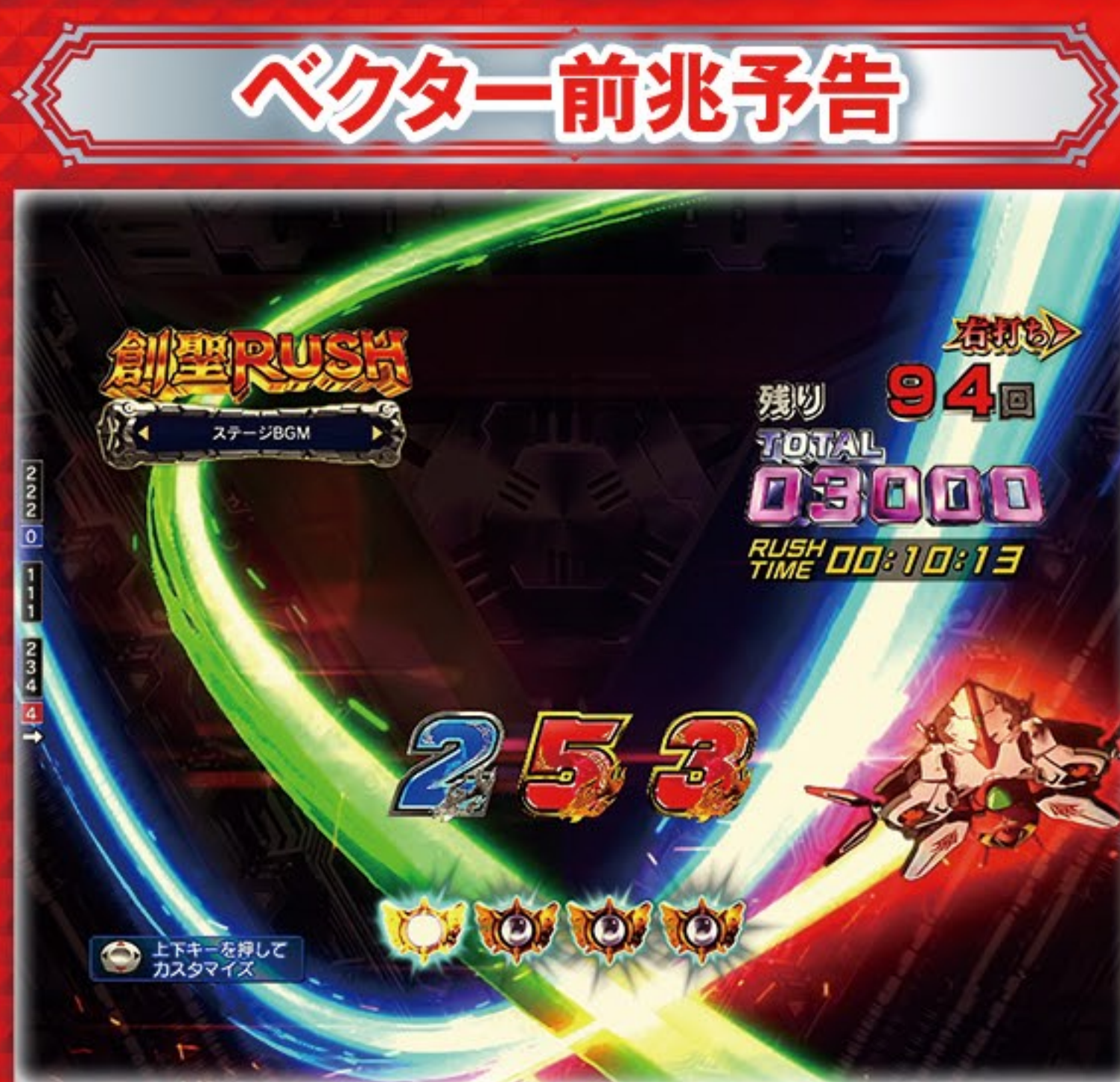
前兆が続くほどチャンス!