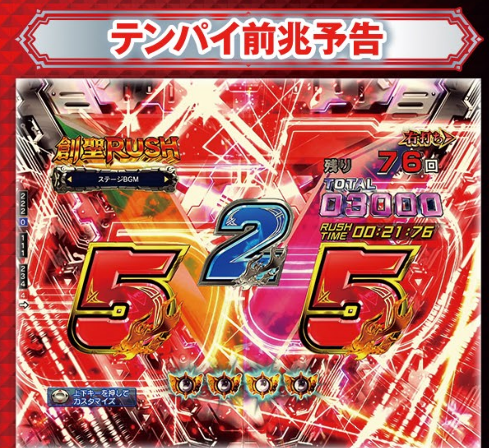
赤図柄テンパイなら!?