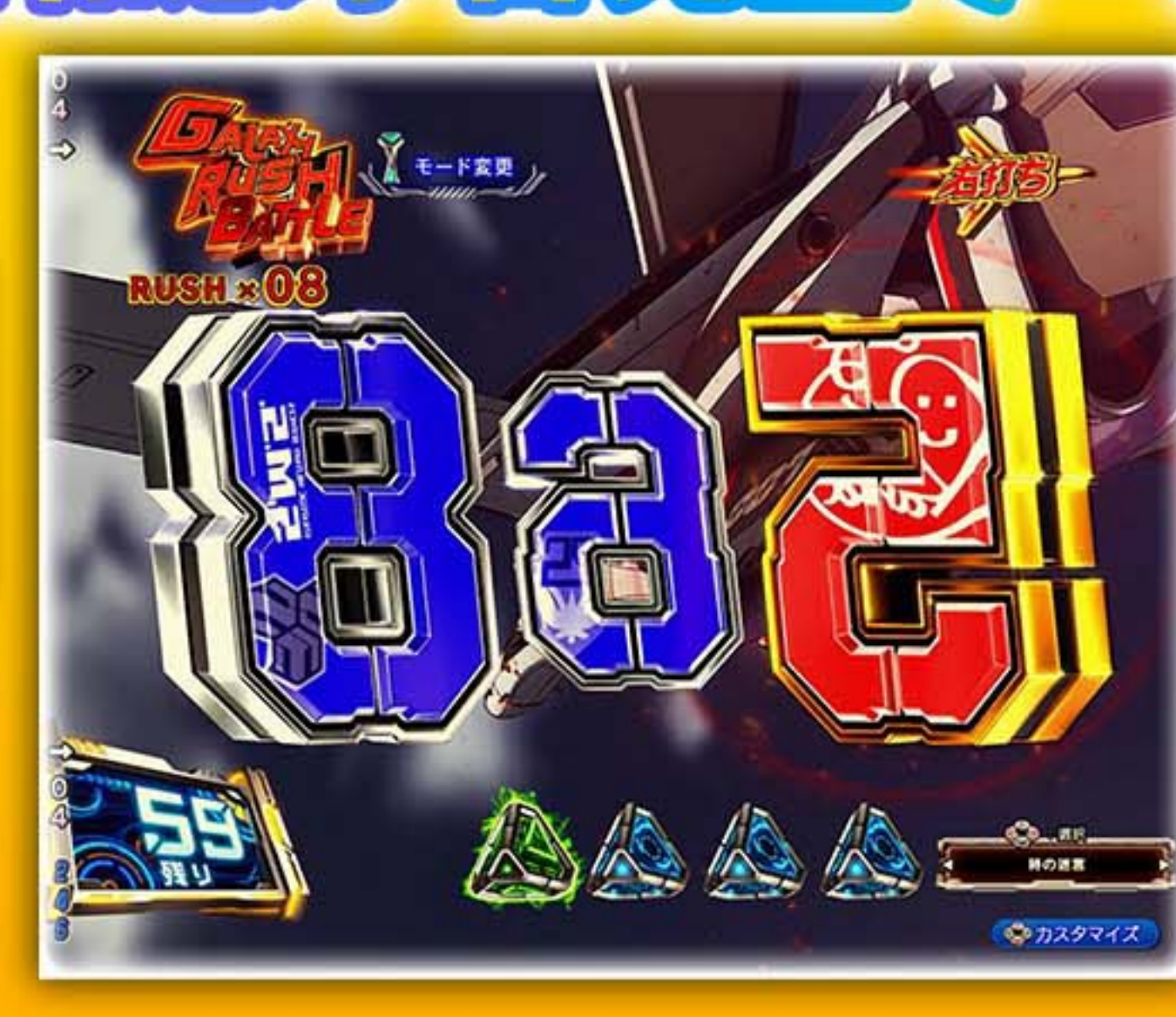
停止時図柄が反転