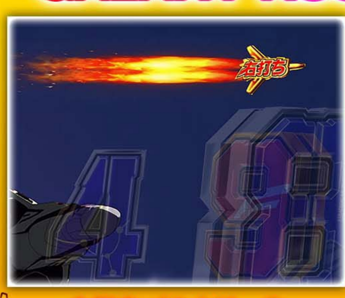
右打ちバルキリーの アフターバーナーが増大

GALAXY RUSH中には複数の違和感予告が存在! 違和感予告発生で...超チャンス!?