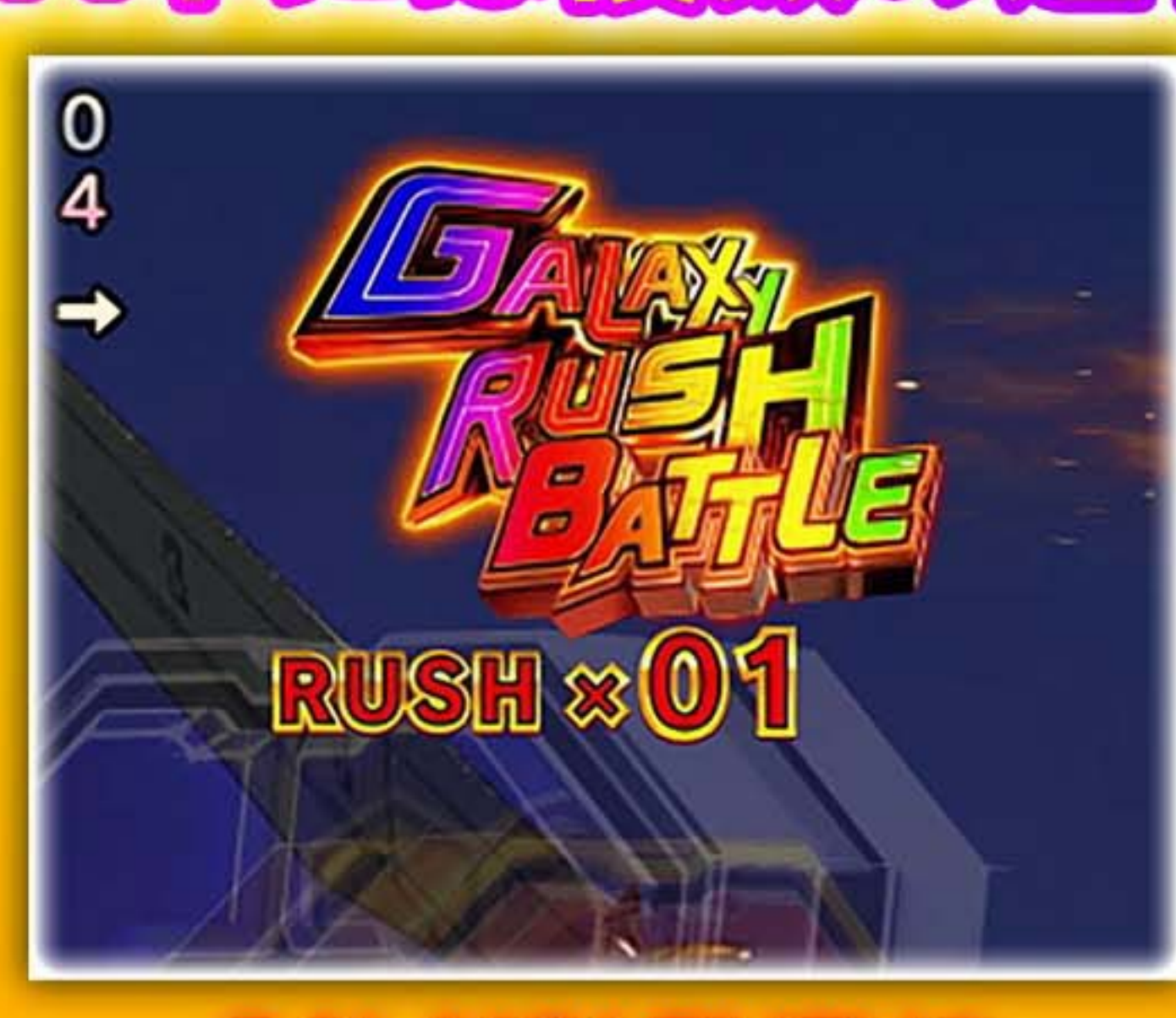
GALAXY RUSHの ロゴが虹色発光