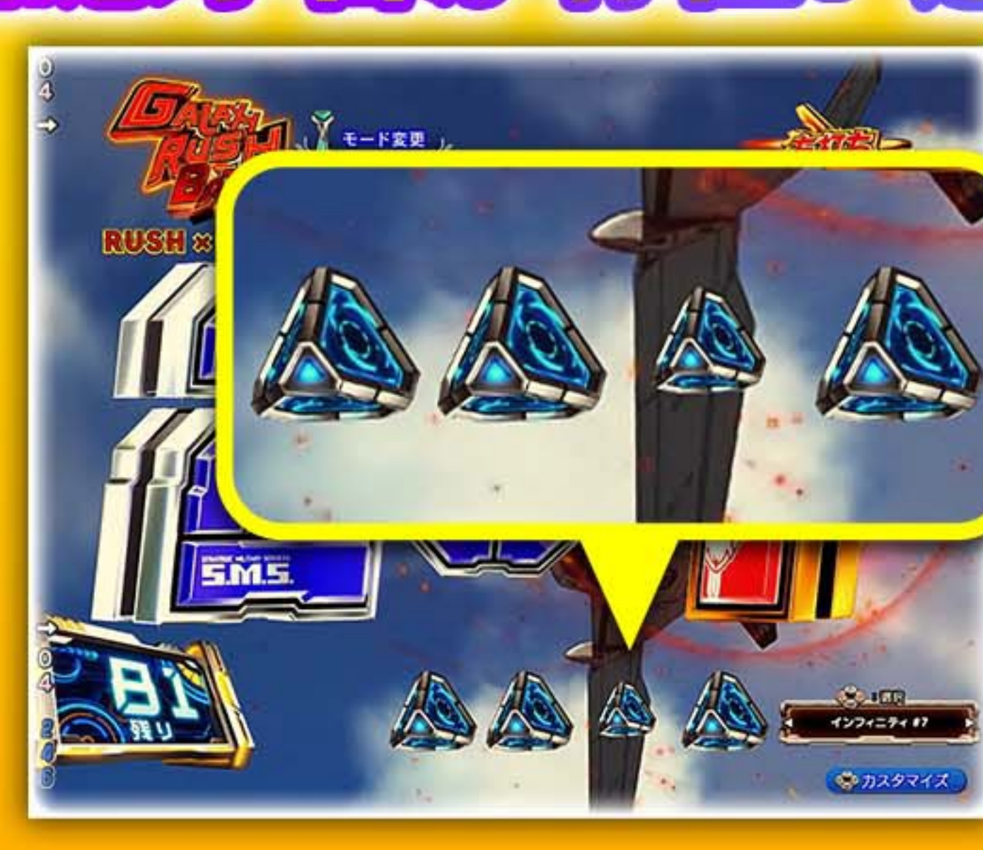
保留サイズが縮小